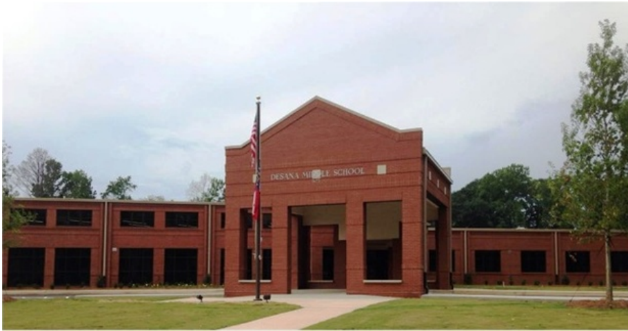
अॅटलांटा मराठी शाळा De Sana Middle School येथे भरते.